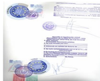
Ejemplar de Título emitido por el Instituto Europeo certificado con la "Apostilla de la Haya"