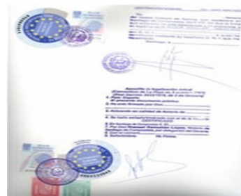
Ejemplar de Título emitido por el Instituto Europeo certificado con la "Apostilla de la Haya"